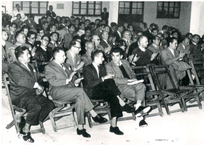
Imagen de la Asamblea Fundacional del Movimiento Social Cristiano, luego Partido Demócrata Cristiano, llevado a cabo el 15 de mayo de 1960, en el Colegio Salesiano de Asunción.

Relevantes figuras intelectuales y políticas jalonan la lista de afiliados, adherentes y simpatizantes del PDC a lo largo de su historia que dieron lustre y honor a la lucha por la libertad y la democracia. Ilustres personalidades escribieron las páginas de gloria de la DC, que nunca claudicó ante el Dictador. Hoy día, el PDC es parte de la Alianza Patriótica para el Cambio y en función de Gobierno, con su Candidato Electo a Presidente Fernando Lugo Méndez, escribe así mismo las páginas de la transición hacia un país más justo y solidario.